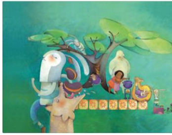
Ilustración de Ruth Angulo