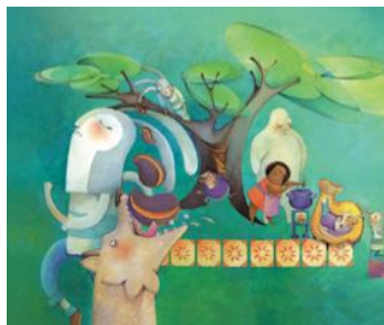
Ilustración de Ruth Angulo Fuente: https://www.behance.net/gallery/29994045/Cuentos-de-mi-Tia-Panchita

Reflexiono sobre los valores que sería importante que se presenten en el cuento.