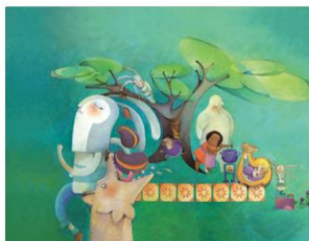
Ilustración de Ruth Angulo