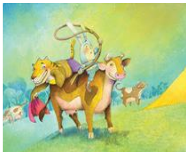
Ilustración de Ruth Angulo Fuente: