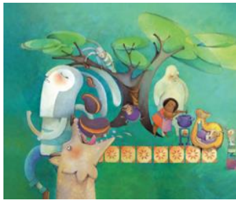
Ilustración de Ruth Angulo

Reflexiono sobre los valores que sería importante que se presenten en el cuento.